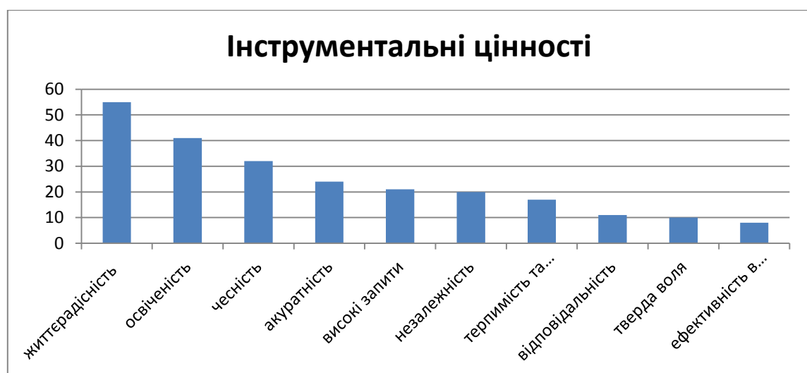
Рис. 3.1.3. Інструментальні цінності респондентів за результатами опитування респондентів по методиці М.Рокича

Отриманні результати нами було представлено на діаграмі (Рис 3.1.3)