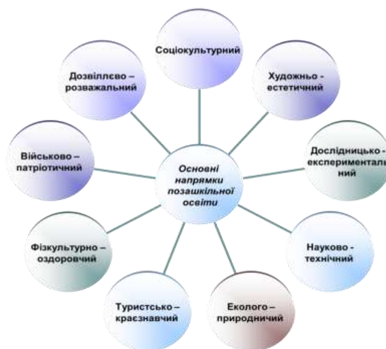
Рис. 1.2. Основні напрями позашкільної освіти та виховання

У ході нашого соціологічного дослідження нами було з'ясовано, що позашкільні заклади міста Свердловська працюють за певними напрямками, які мають створити умови для професійної орієнтації та самовизначення особистості, від формування стійких мотивів до самореалізації у професійній діяльності, підготовку молоді до змін професій, адаптації до ринкової економіки. На підставі дослідження нами було розроблено схему напрямів роботи позашкільної освіти, зображену на Рис. 1.2.