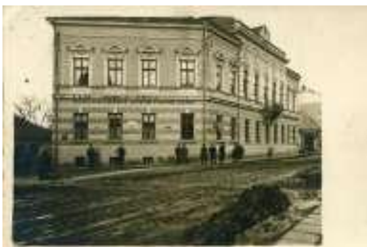
Рис 1.1. «Народний будинок»

Система культурно-дозвілдової діяльності сформувалася не відразу. Її становлення і розвиток охоплює досить значний історичний період. Але, найбільше інтенсивно вона створювалася наприкінці ХІХ ст. Ознаки методичної діяльності почали виявлятися на початку ХХ ст. У цей період стали створювати народні будинки. У народному будинку, як правило, працювали самодіяльні гуртки, проводилися концерти, читалися лекції. Більшість народних будинків мали у своєму розпорядженні концертний зал, набір народних інструментів, бібліотеку-читальню, чайну. Великий інтерес викликало театральне мистецтво.