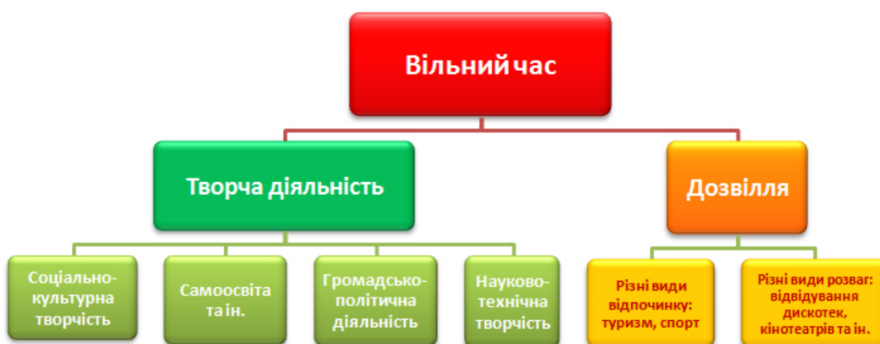
Рис 2.3. «Напрямки дозвіллевої діяльності»

В останні роки в Україні відбулися радикальні зміни, у всіх сферах суспільного життя, які стали причиною виникнення низки гострих проблем, серед яких і проблеми молоді. Однією зі сфер її життєдіяльності, де найбільш яскраво проявляються наслідки цих трансформацій, є як ми вже аналізували раніше дозвілля.