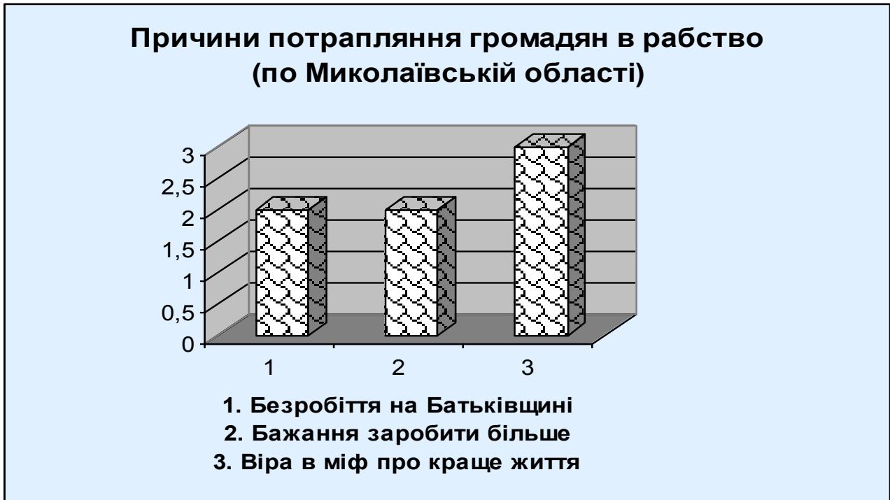
Рис. 3.2. Основні причини потрапляння громадян в рабство за даними експертного опитування по Миколаївській області