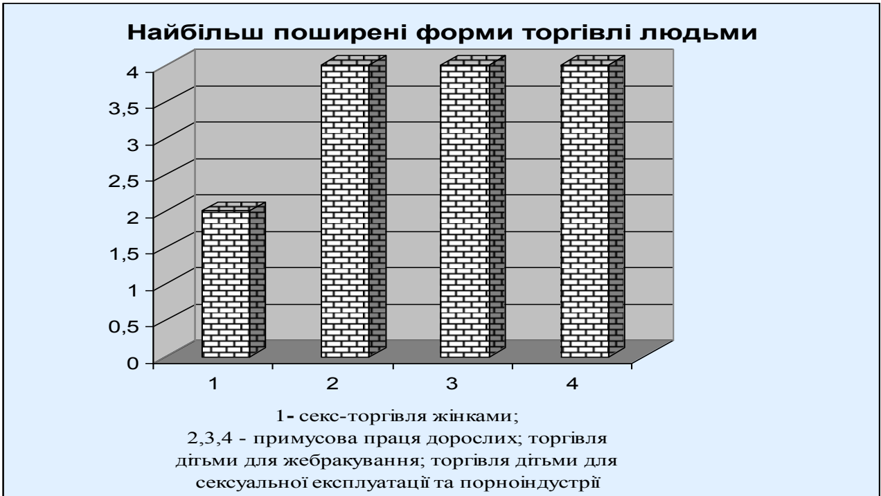
Рис. 3.3. Найбільш поширені форми торгівлі людьми