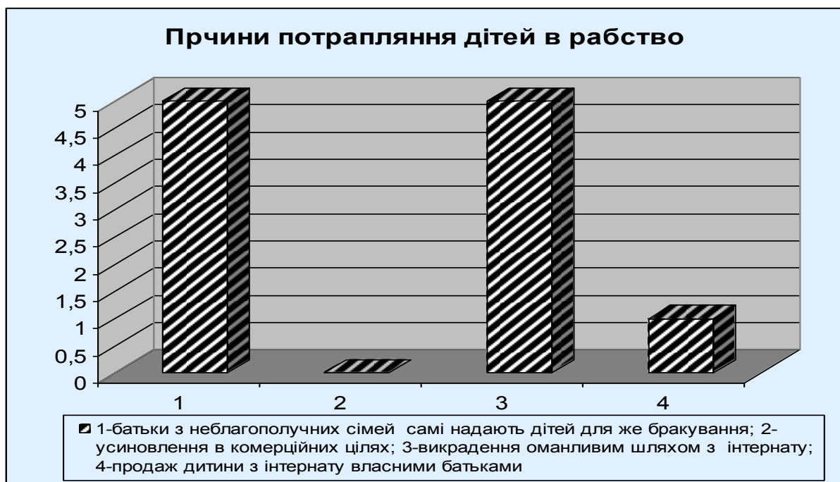
Рис. 3.4. Найчастіші причини потрапляння дітей в рабство

На прохання проранжувати причини найчастішого потрапляння в рабство дітей та неповнолітніх (від 1 – найменше, до 5 – найчастіше) відповіді експерта розташувались таким чином (гістограма рис. 3.4.)