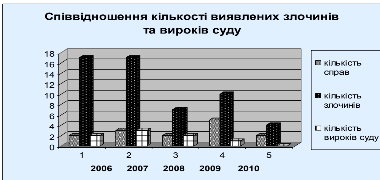
Рис. 3.1. Співвідношення кількості виявлених злочинів в сфері торгівлі людьми та кількості вироків суду

Дослідження з виявлення найбільш поширених форм торгівлі людьми на державному та регіональному рівнях проводилося в Миколаївському благодійному фонді «Любисток». У ході проведення дослідження були отримані результати, які були піддані подальшій обробці і детальному аналізу. Для цього було використано експертне опитування (опитувальний лист, додаток А), результати якого представлені в узагальненому вигляді в таблиці (додаток В). Проаналізувавши їх, маємо загальні висновки. Зупинимось на деяких із запитань. Так, на запитання «Наскільки актуальною є проблема торгівлі людьми для України?» експерт обрав відповідь «Дуже актуальною». Зі слів респондента, в середньому, щороку, в Україні виявляється близько 30 осіб (із дорослого населення) жертв работоргівлі. Що стосується Миколаївської області, то за період з 2006 по 2010 р.р. таких злочинів було здійснено – 55. Співвідношення кількості виявлених злочинів за якими порушувалися кримінальні справи, та кількості вироків суду за результатами судових розглядів наглядно зображено гістограмі (Рис. 3.1) та в таблиці (додаток Д).